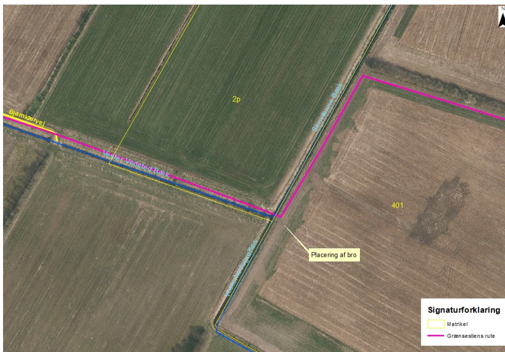
Figur 1: Oversigtskort med placering af bro og grænsestiens forløb (pink).

Broen skal gå mellem de to matrikler 2p V. Vedsted By, V. Vedsted og 401 Roager Ejerlav, Roager (se figur 1 for oversigtskort).